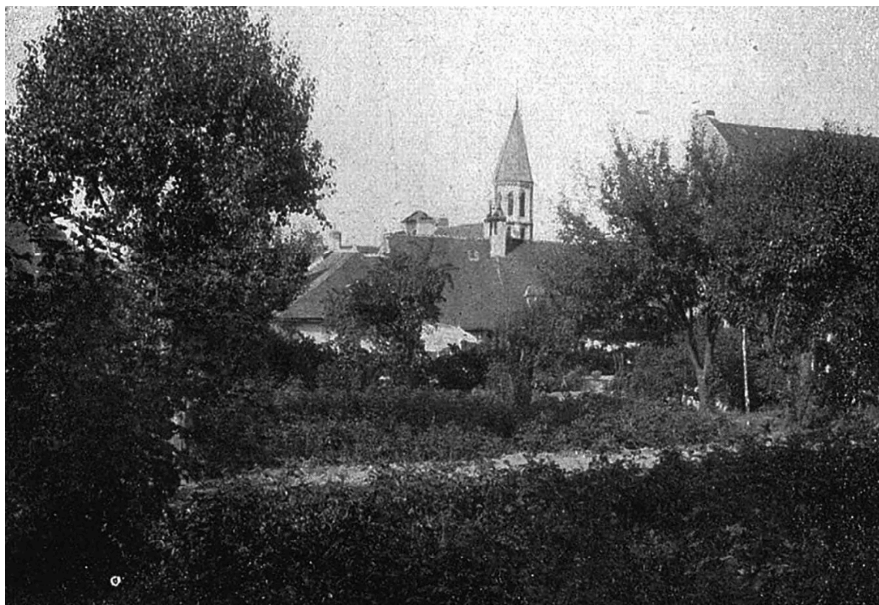
La maison des Jouhandeau, vue du fond de leur jardin

Une ville imaginaire, qui contrairement au Combray de Marcel Proust, fume du sang des bêtes, et non de la chaleur du thé. Surtout, Jouhandeau ne se limite pas à ses souvenirs d'enfance, mais ravive des récits bien antérieurs à sa naissance, élevant la chronique d'un petit bourg de province au rang d'un mythe.