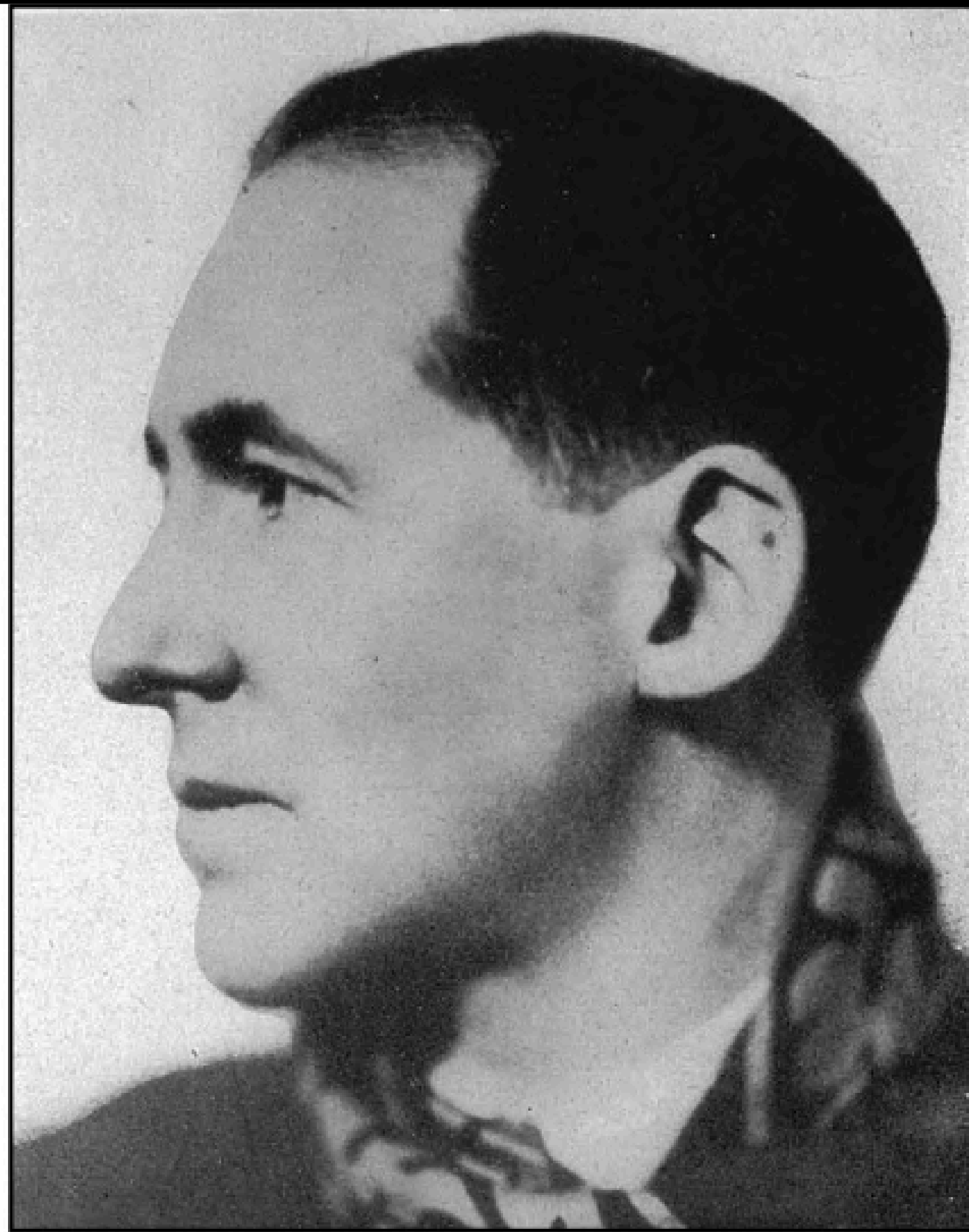
Marcel Jouhandeau en 1925

Fils de boucher et mystique tourmenté, ami des plus grands artistes du siècle mais paria dans sa propre ville, Marcel Jouhandeau (1888-1979) est l'un des secrets les mieux gardés de la littérature française.