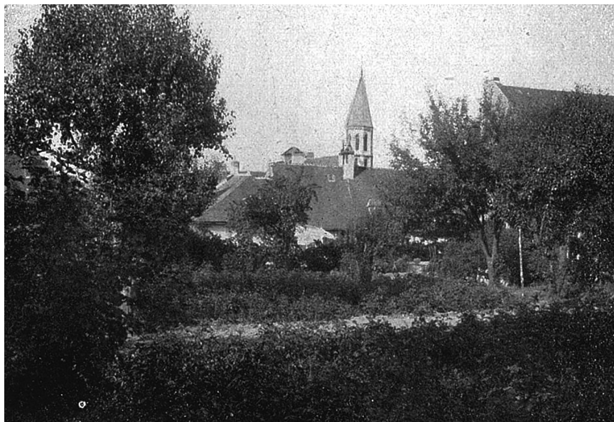
La maison des Jouhandeau, vue du fond de leur jardin

Plaquette à l'occasion de l'exposition « Marcel Jouhandeau et ses amis » à la Bibliothèque du Grand-Guéret. ( juin-août 2026 )